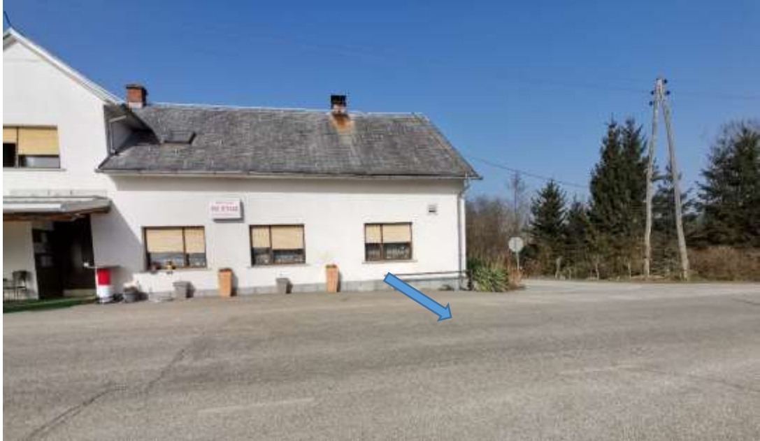
Slika 22: Avtobusno postajališče na Dolnjih Slavečih 3