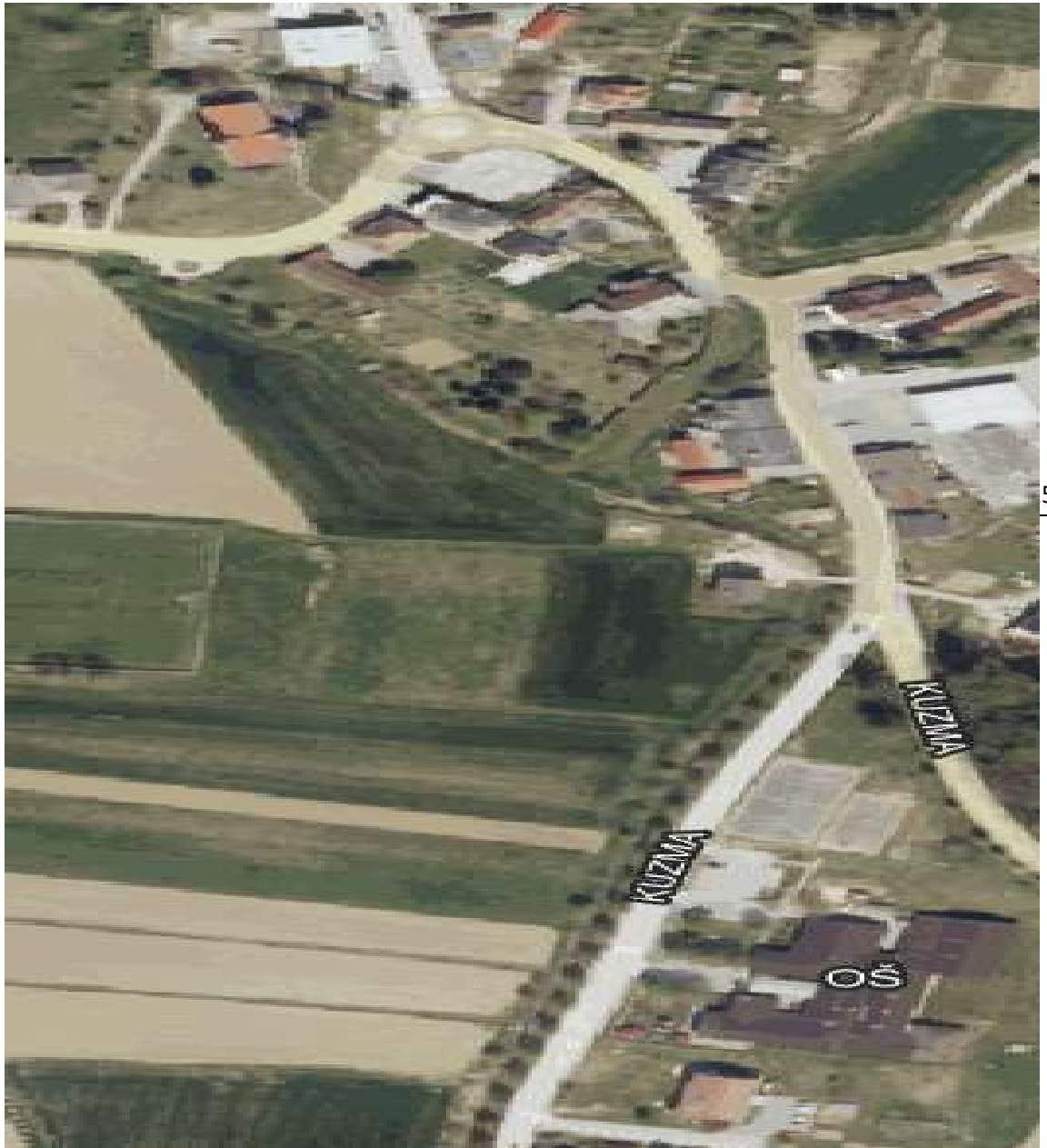
Slika 6: Smer Sotina – Mercator – OŠ Kuzma

Prečkajo parkirni prostor pred trgovino Mercator, nato hodijo po pločniku, ki potekal po levi strani vozišča (odsek 3) do križišča ceste Kuzma – Grad. Cesto prečkajo po prehodu za pešce, ki je vrisan in nadaljujejo pot po pločniku ob igrišču. Pri osnovni šoli, naj učenci po pločniku pristopijo do parkirnega prostora za učitelje, po katerem se odpravijo v šolsko stavbo.