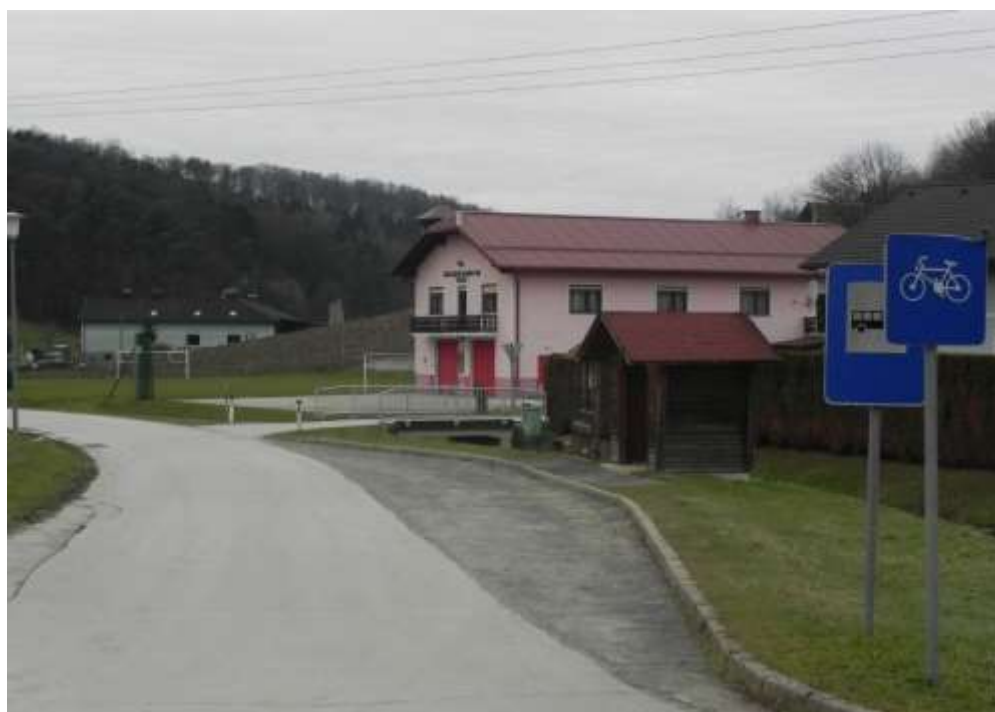
Slika 18: Avtobusno postajališče v Trdkovi – spodaj