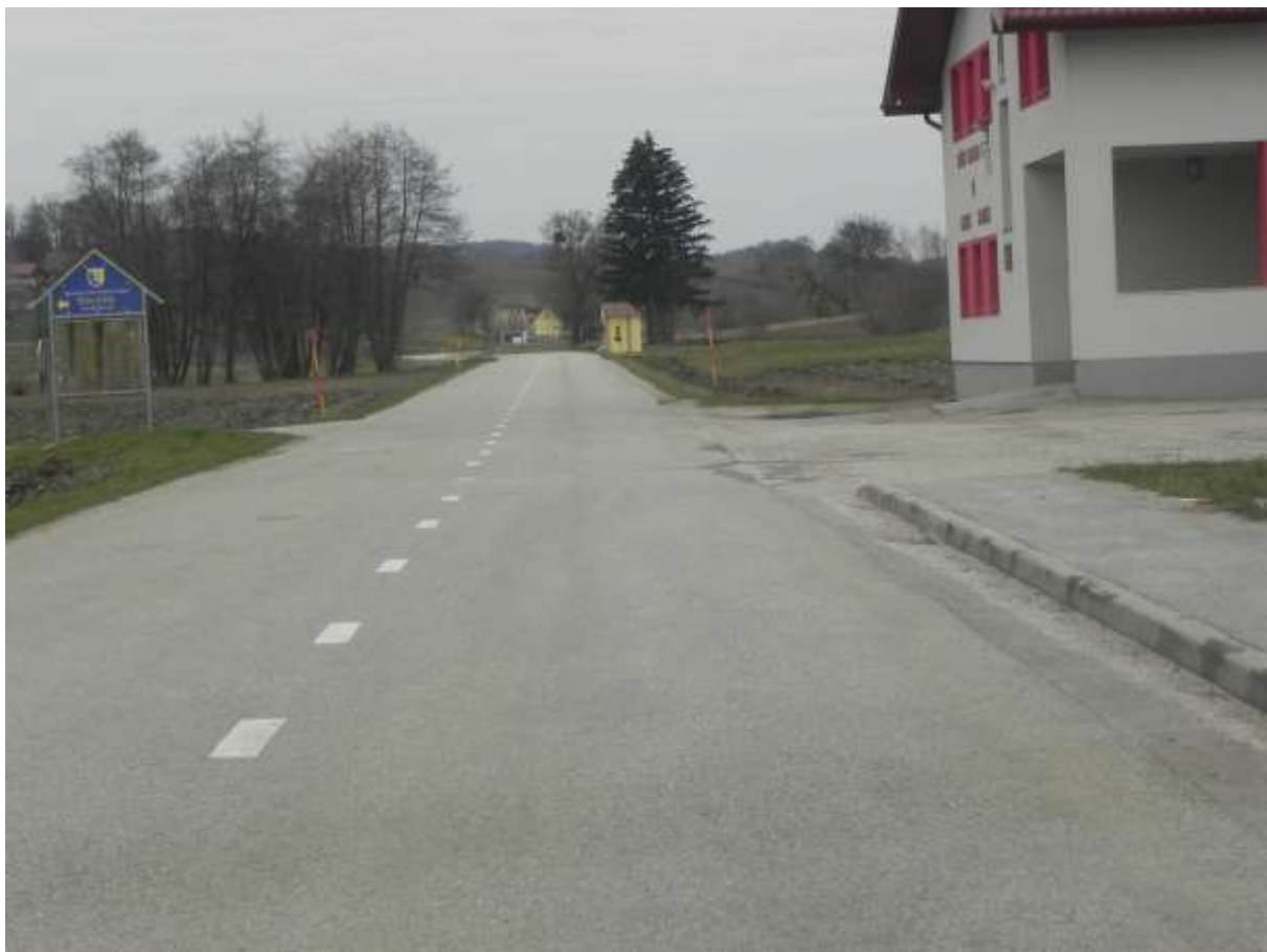
Slika 12: Nevarni odsek na RC 727 Gornji Slaveči konec pločnika in ca. 2000 metrov morajo pešci hoditi po levi strani vozišča predvsem ob zmanjšanji vidljivosti uporaba lučke in odsevne kresničke, odsevnega jopiča.