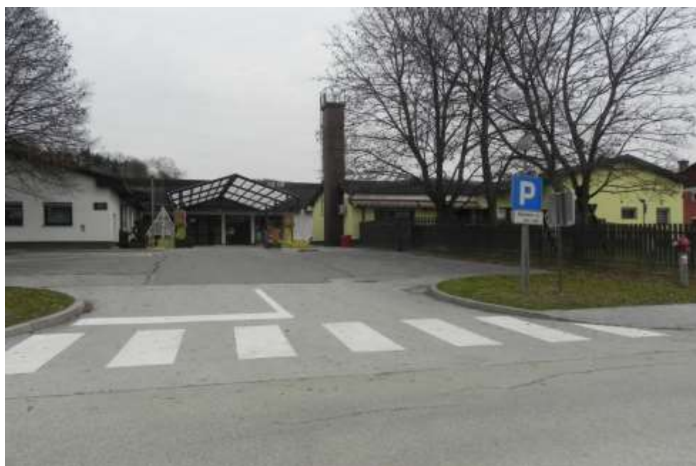
16: Avtobusno postajališče pred OŠ Kuzma