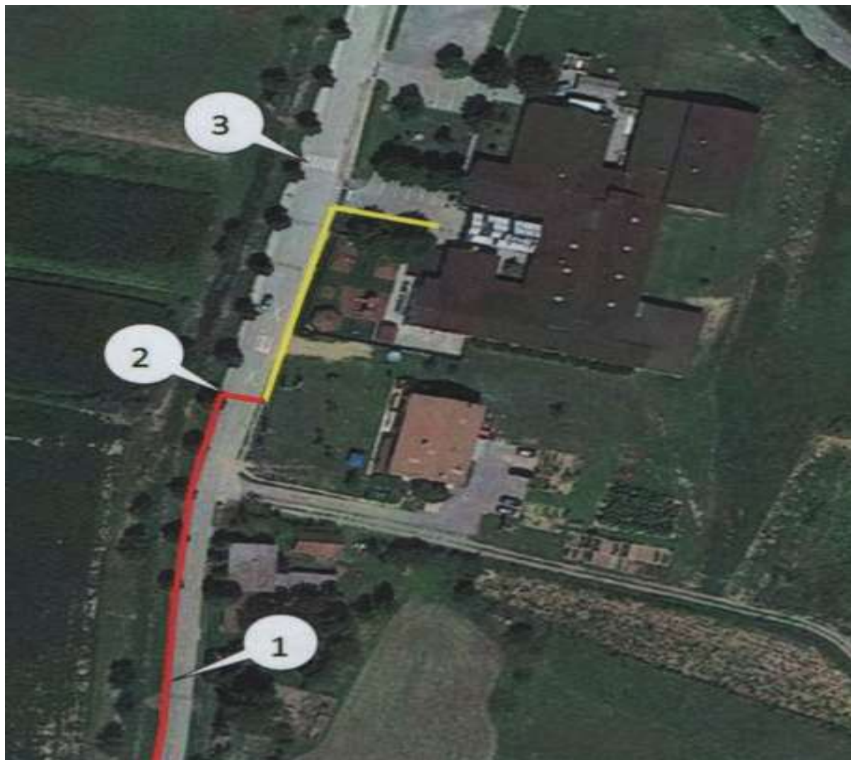
Slika 10: Smer Dolnji Slaveči – OŠ Kuzma