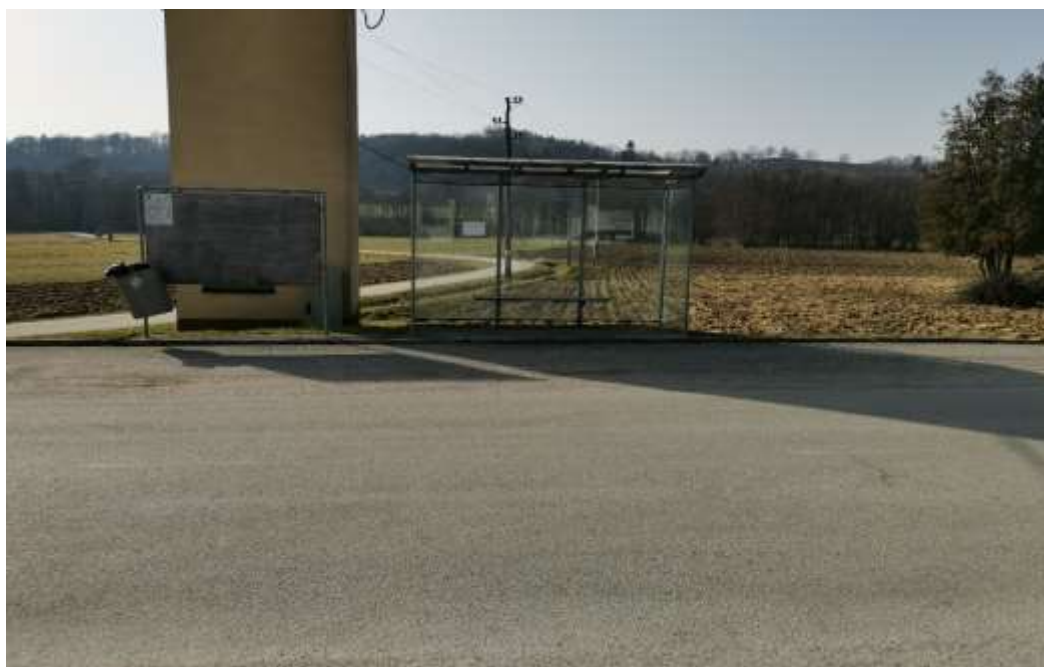
Slika 20: Avtobusno postajališče na Dolnjih Slavečih 2 (pri gasilskem domu Dolnji Slaveči)