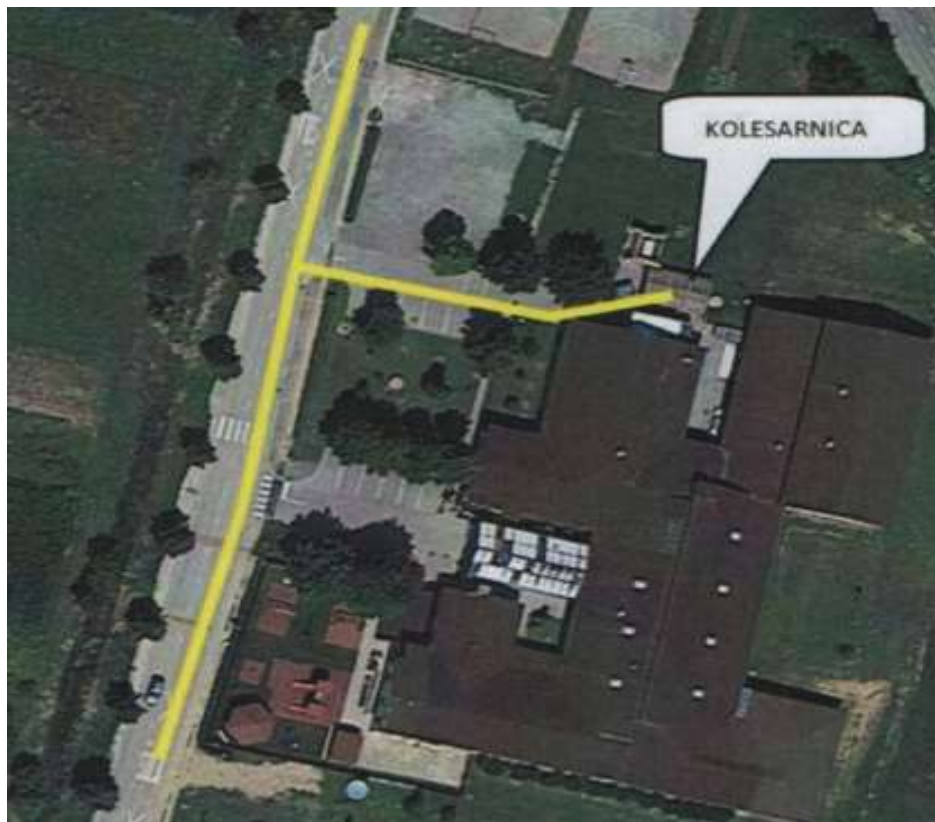
Slika 4: Kolesarnica

Otrok od 12. do 14. leta starosti , ki ima pri sebi kolesarsko izkaznico, in oseba, ki je starejša od 14 let , sme voziti v cestnem prometu kolo s pomožnim motorjem.