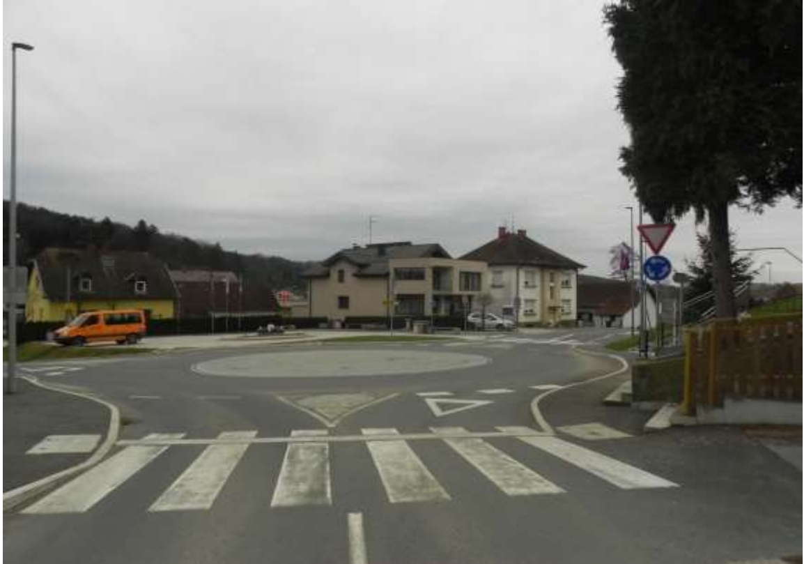
Slika 8: Prikazuje krožišče, ki je ustrezno urejeno s prometno signalizacijo

Učenci prehajajo v šolo iz smeri Sotine po pločniku mimo zgradbe občinske uprave Kuzma do prehoda za pešce pri krožišču. Cesto prečkajo na prehodu za pešce in nadaljujejo po pločniku do križišča Dolič – Grad, kjer prečkajo vozišče kjer je vrisanega prehoda za pešce in nato dalje mimo gostilne Gabršek po pločniku mimo trgovine Mercator do Y križišča Grad – Gornji Slaveči, kjer prečkajo prehod za pešce in pot nadaljujejo po pločniku do parkirnega prostora pred OŠ Kuzma in zavijejo levo, ker po parkirnem prostoru pridejo do vhoda v šolo.