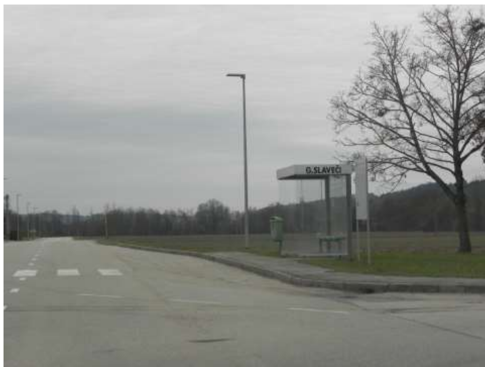
Slika 17: Avtobusno postajališče v vasi Gornji Slaveči