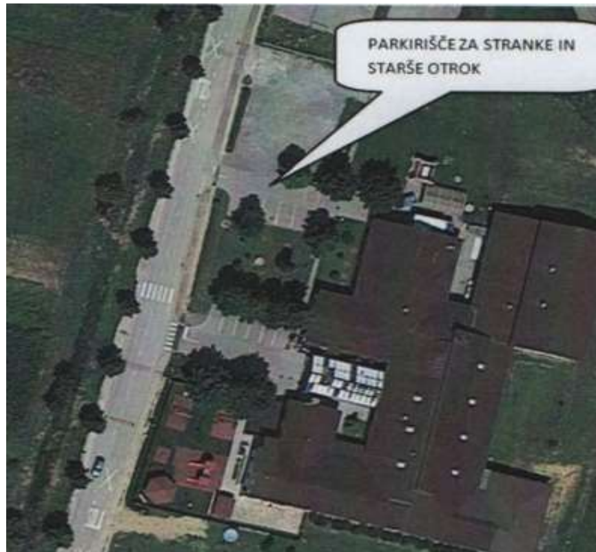
Slika 3: Parkirišče za stranke šole in za starše otrok

Pri prevozu otrok v šolo starši imajo težave s parkiranjem, saj ni zagotovljenih zadostno številko parkirnih prostorov. Priporočamo, da vsi starši parkirajo na urejenem parkirnem prostoru za stranke in starše otrok. V kolikor zaradi gneče parkirajo drugje oziroma ob skrajnem desnem robu desnega smernega vozišča gledano v smeri Gornjih Slavečev, saj morajo upoštevati pravila parkiranja, ki so določena v 65. členu Zakona o pravilih v cestnem prometu. Starši in otroci naj vozišče prečkajo na prehodu za pešce, ki je pravilno označen gledano v smeri stavbe OŠ Kuzma.