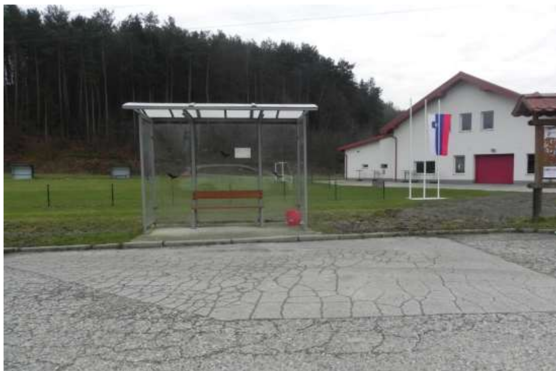
Slika 15: Avtobusno postajališče v vasi Dolič