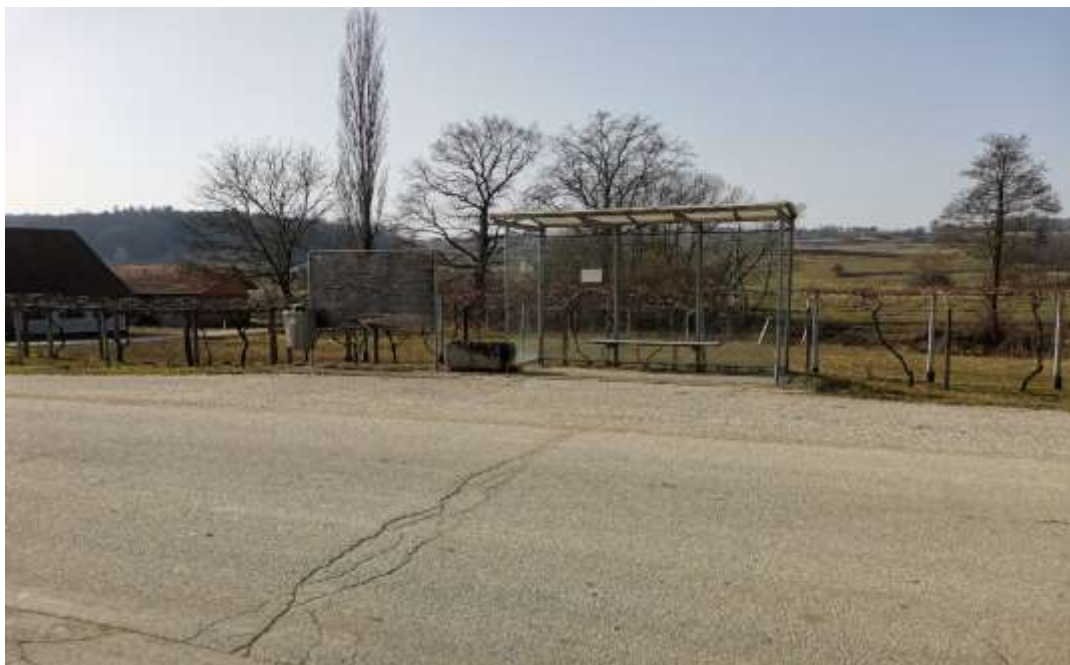
Slika 19: Avtobusno postajališče na Dolnjih Slavečih 1