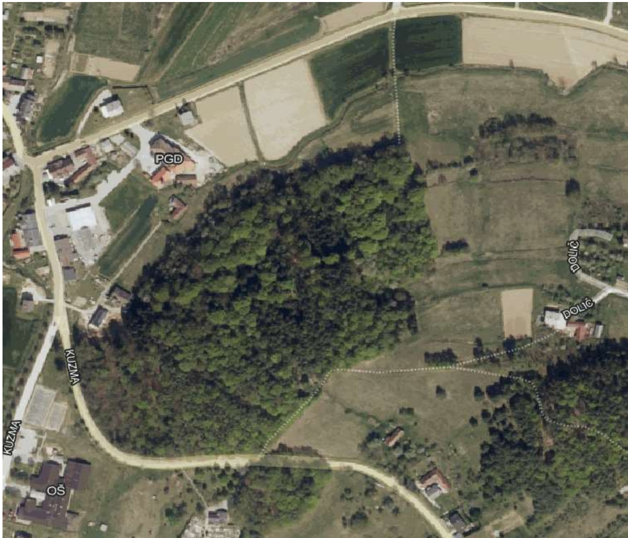
Slika 5: Smer pešpoti Dolič - Kuzma

Učenci prehajajo v šolo iz smeri Doliča hodijo po pločniku, kateri poteka ob desnem smernem vozišču in poteka vse do križišča z odcepom za vas Matjaševci. Nato prečkajo vozišče in peš nadaljujejo po levi strani pločnika. Nato prečkajo parkirni prostor pred gasilskim domov in nadaljujejo pot po pločniku (odsek 2).