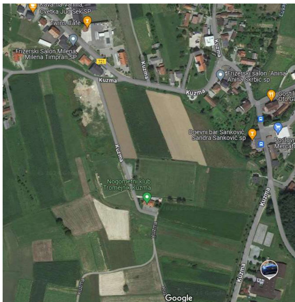
Slika 7: Smer pešpoti Sotina – Mercator – OŠ Kuzma z vrisanimi pločniki in prehodi za pešce